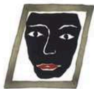
Porträtt i ram | Färggravyr | 60 x 43 cm | Upplaga 66