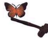
Hårda bud | Färggravyr | 32 cm 60 x 43 cm | Upplaga 66