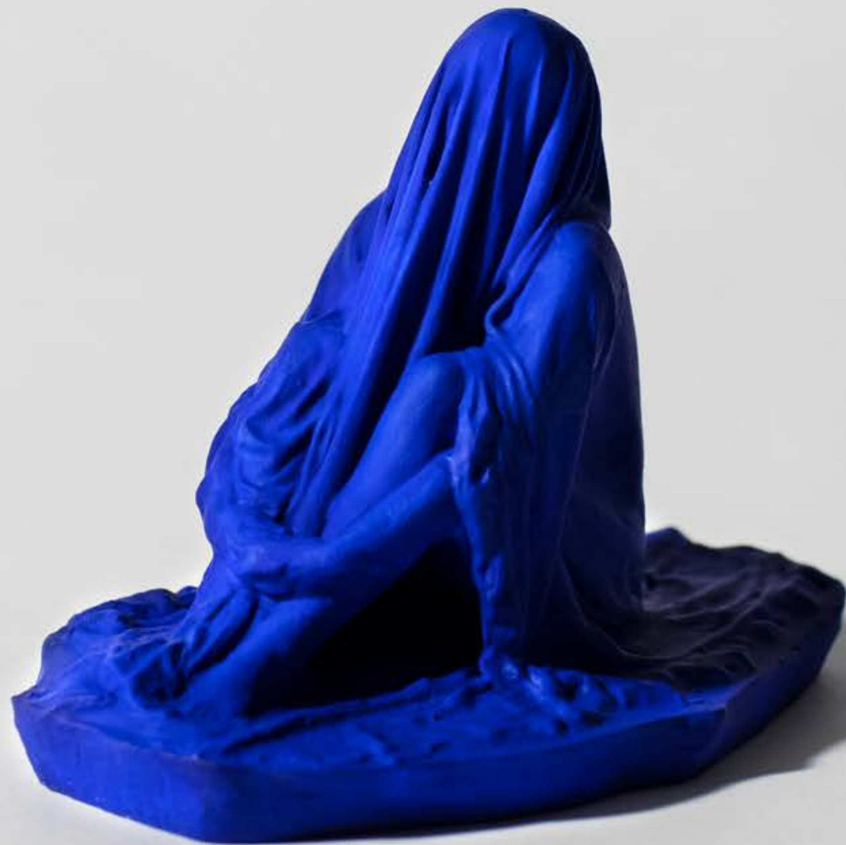
Tove Kjellmark, Myspace (blå) , 7,2x9,4x6 cm. 5 st vinster.