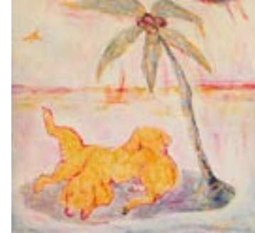
Vinst. Suzanne Nessim, Utan titel 2 . Sid. 7