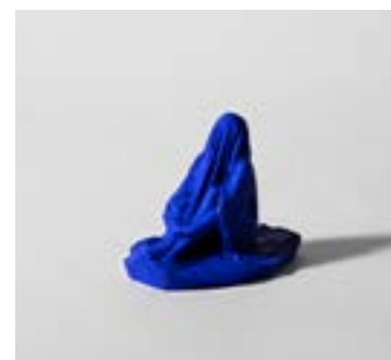
Vinst. Tove Kjellmark, Myspace (blå) . Sid. 4