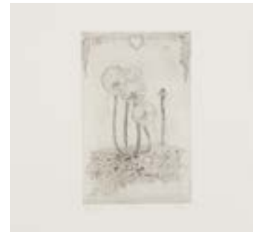
Vinst. Tommy Sveningsson, #Gnome 1 . Sid. 2