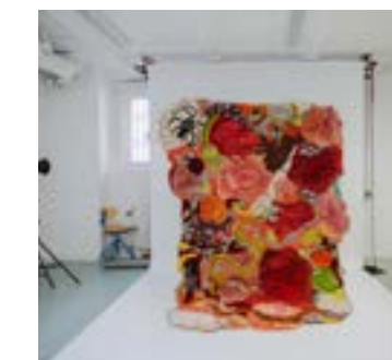
Stipendiat. Anja Fredell. Sid. 16