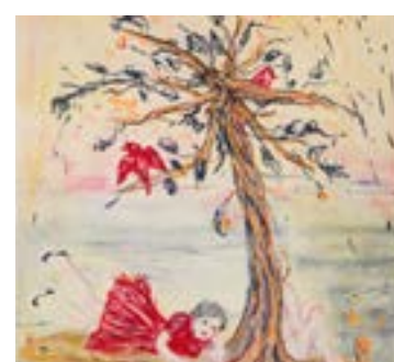
Vinst. Suzanne Nessim, Utan titel 1 . Sid. 6