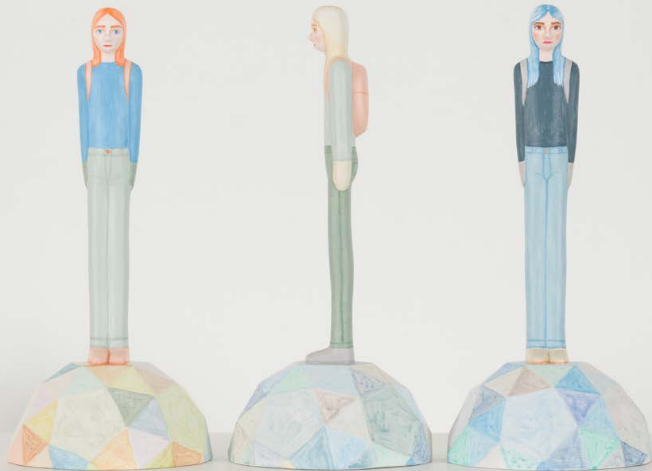
Sara Nilsson, Rookie . Nummer 6, 7, 8. 3D-print av träbaserad biokomposit. 26x12x12 cm. Upplaga 8.