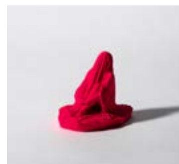
Vinst. Tove Kjellmark, Myspace (rosa) . Sid. 5