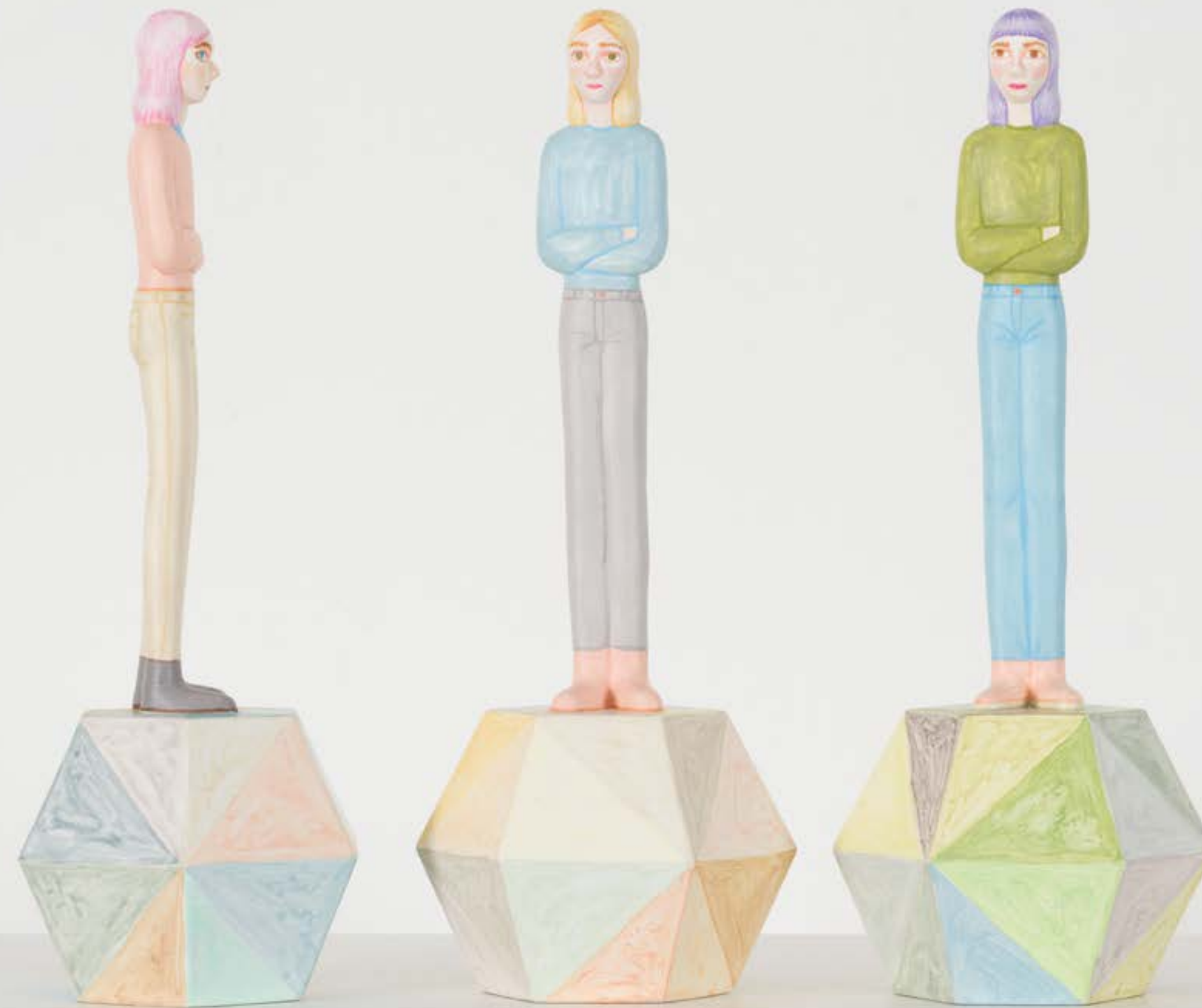
Sara Nilsson, Eko . Nummer 6, 7, 8. 3D-print av träbaserad biokomposit. 29x11x10 cm. Upplaga 8.