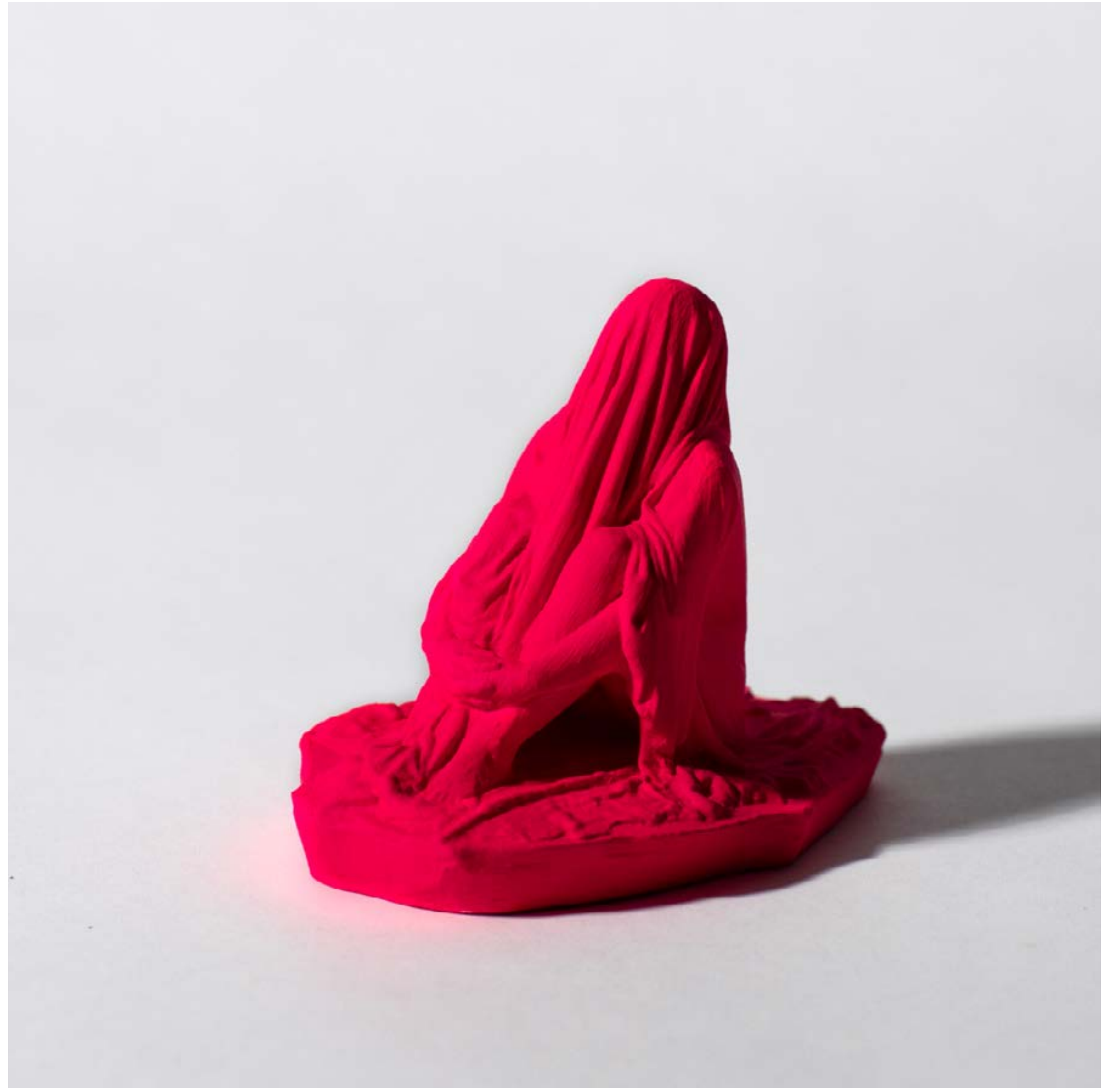
Tove Kjellmark, Myspace (rosa) , 7,2x9,4x6 cm. 5 st vinster.

“Min kropp är mitt space, min arkitektur, i ständig rörelse och förändring. Jag välkomnar andetaget och går in i mörkret inom mig. Om jag stänger ögonen så befinner jag mig i ett rum fyllt av potential. Det är öppet, oändligt, gränslöst. Jag färdas genom varje korridor, portal, aveny inom mig. En känsla av att vara på roadtrip i kroppen, där varje vägsträcka är ny, unik och annorlunda. Jag lutar mig nyfiket mot utsikten under en resa med varken början eller slut.”