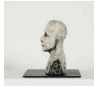
Högvinst. Ellen Lindström, Begrundad . Sid. 8